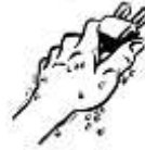
NO MANI BAGNATE