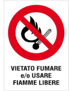
VIETATO FUMARE e/o USARE FIAMME LIBERE

L'incendio è la combustione (reazione chimica di un combustibile con un comburente in presenza di innesco) sufficientemente rapida e non controllata che può svilupparsi senza limitazioni nello spazio e nel tempo. Il rischio di incendio è sempre presente in qualsiasi attività lavorativa.